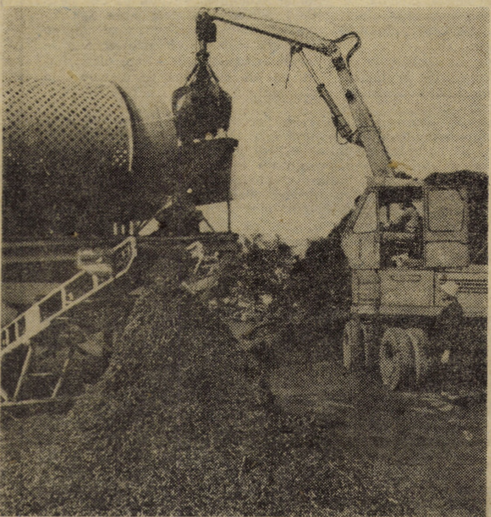
RECUPERARE, RECONDIȚIONARE, REFOLOSIRE — o acțiune la ordinea zilei! În cadrul acestor multiple preocupări, în secția de pe str. Oțelariilor a I.J.R.V.M.R. Sibiu se lucrează cu utilaje specializate la măcinarea și balotarea șpanului, în vederea expeditiei la beneficiarii din siderurgie