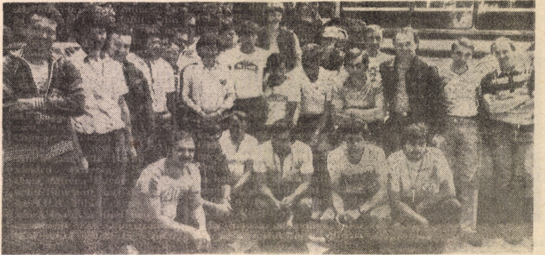
Lotul național de automobilism al României, gata de start