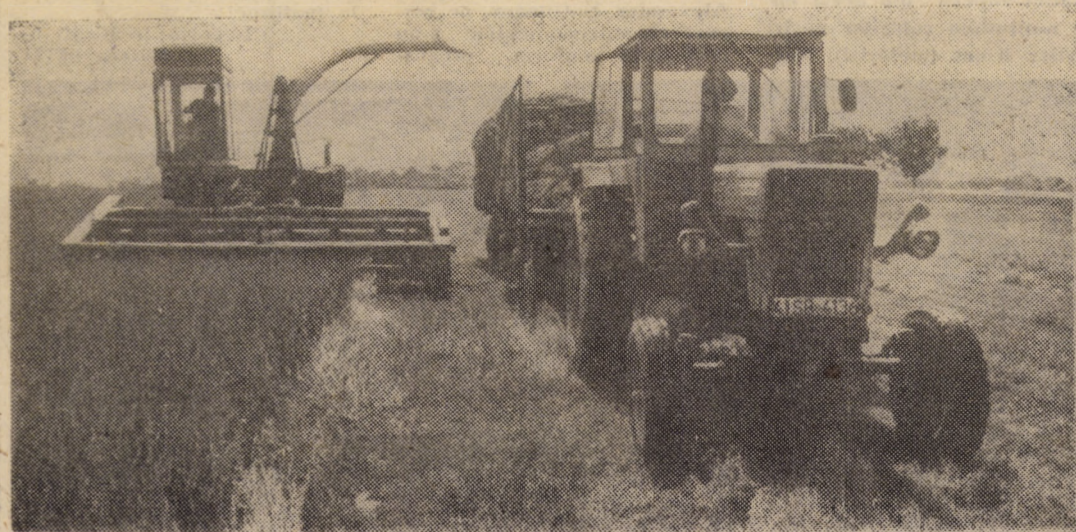
La A.E.I. Orlat se recoltează din plin un amestec din graminee, furaj deosebit de valoros pentru hrana animalelor. Zilnic, se înregistrează o cantitate recoltată de peste 120 tone