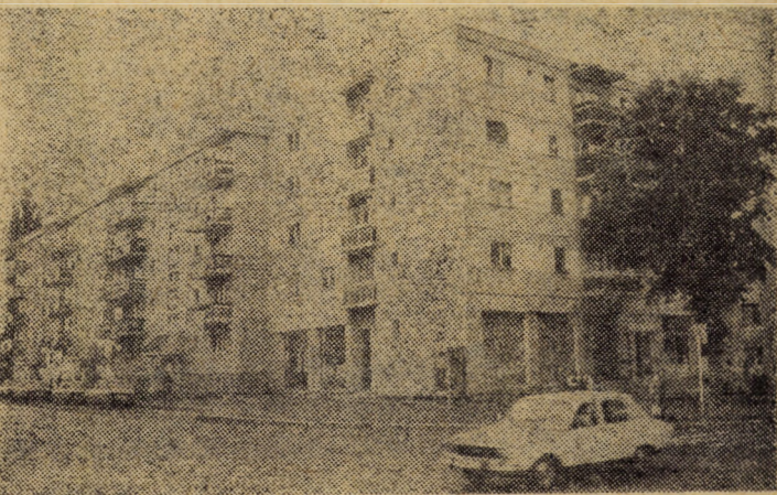
Vă prezentăm în imagine grupul de blocuri nou construite la intersecția Căii Dumbrăvii cu strada Lomonosov din Sibiu

În numele tovarășului Nicolae Ceaușescu, președintele Republicii Socialiste România, tovarășul Manea Mănescu, vicepreședinte al Consiliului de Stat, a înmînat, miercuri după-amiază, în cadrul unei festivități care a avut loc la Palatul Marii Adunări Naționale, distincții ale Republicii Socialiste România organizațiilor județene de partid, consiliilor populare județene, unităților economice și institutelor de cercetare științifică, inginerie tehnologică și de proiectare care au ocupat locurile 2 și 3 în întrecerea socialistă pe anul 1984, precum și diplome de onoare.