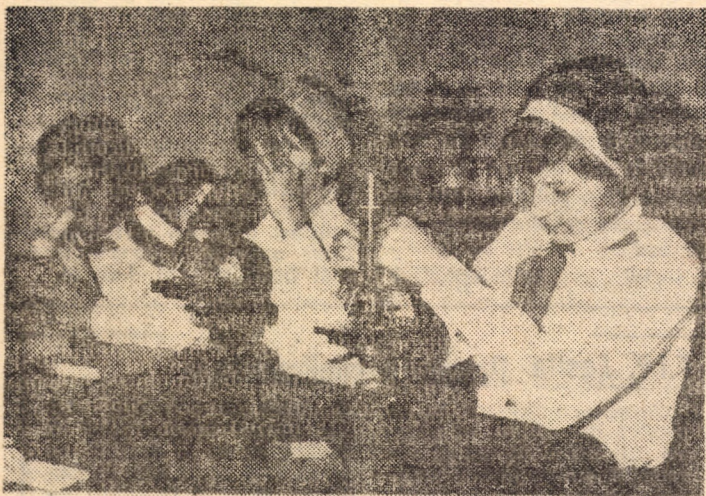
O imagine elocventă de la cercul de floricultură al Casei pionierilor și șoimilor patriei din Mediaș.

Expoziția poate fi vizitată zilnic, până în data de 26 august a.c., între orele 10—18.