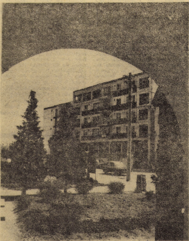
O ilustrată din Ocna Sibiului, azi, imagine-simbol a unei așezări plină de tinerețe, dinamism și vigoare.