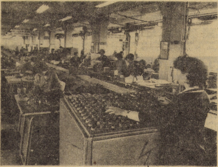
Secvență de muncă din noua secție pentru confecționarea articolelor de marochinărie din Săliște, aparținînd întreprinderii „13 Decembrie” Sibiu. În prim plan, o linie automată pentru confecții mape și serviete.