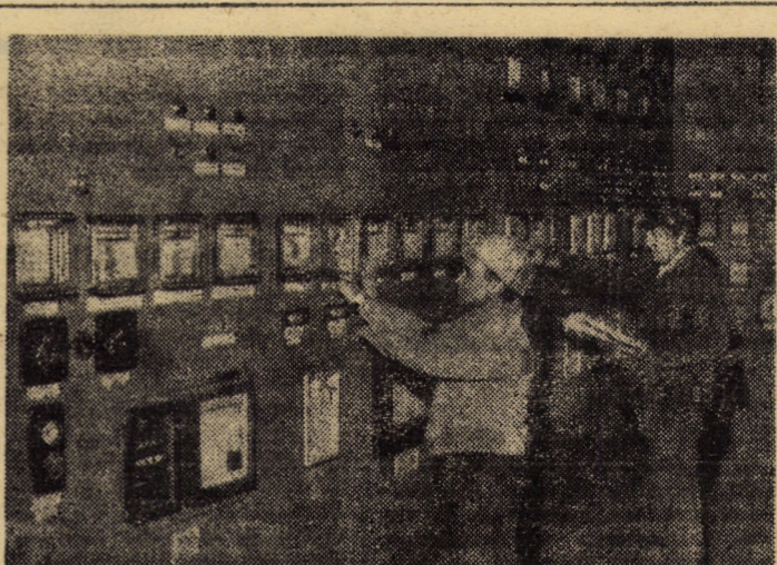
În cele două decenii care au trecut de la Congresul al IX-lea al partidului — perioadă pe care cu mindrie patriotică o numim „Epoca Nicolae Ceaușescu” — numeroase unități economice din județul nostru au cunoscut o impetuoasă dezvoltare. Printre acestea se numără și I.M.M.N. Copșa Mică — în fotografie camera de comandă a furnalului — care cincinal după cincinal a beneficiat de însemnate fonduri destinate dezvoltării și modernizării