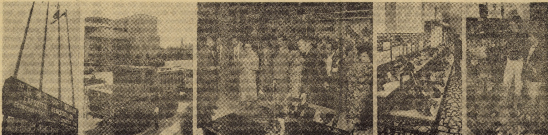
Imagini din expoziția deschisă ieri la Sibiu

În șirul amplelor manifes- tări organizatorice, politice și culturale dedicate împlinirii a două decenii de la Congresul al IX-lea al partidului, ieri după-amiază, la Casa de cul- tură a sindicatelor din Sibiu, a avut loc deschiderea „Expo-