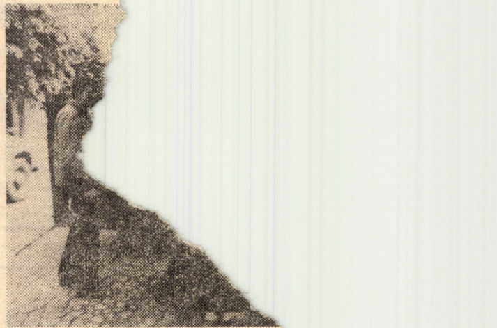
Aspect surprins la una din numeroasele manifestări culturale organizate de I.J.R.V.M.R. pentru colectarea materialelor referitoare la tradițiile și obiceiurile populației din municipiul Sibiu. Imaginea este de la str. Kolarov

Concluzionînd, se poate spune că ediția din acest an a festivalului a reprezentat o certă reușită, fapt ce onorează și răsplătește eforturile organizatorilor. (O. Rusu).