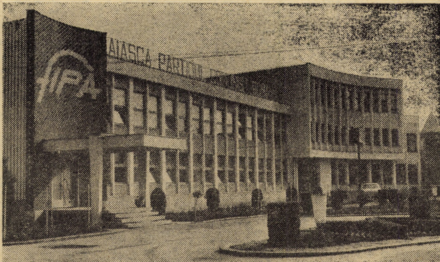
O ilustrare veridică a procesului de înnoire a peisajului agnițean - Întreprinderea de piele și încălțăminte, unitate reprezentativă a industriei ușoare românești

Agnita acestui an - simbolic arc peste timp - s-a ridicat și s-a consolidat, material și spiritual, prin neodihna și priecerea oamenilor săi, care o dăruiesc, încărcată și aureolată de alte și alte frumoase realizări, viitorului.