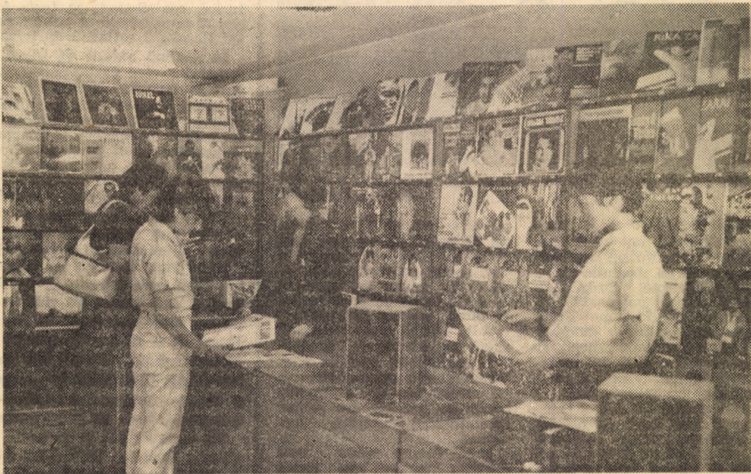
Vă prezentăm o imagine surprinsă la librăria „Lucașfăru” din Sibiu unde melomanilor li se oferă un bogat sortiment de discuri, cuprinzând toate genurile muzicale.