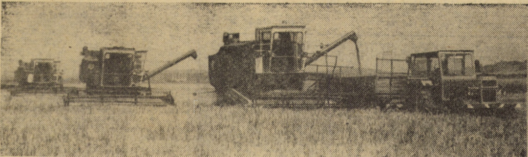
Imagine cu valoare de simbol pentru aceste zile în care importante forțe sînt antrenate la strângerea și depozitarea recoltei de orz

În pofida oscilațiilor meteorologice foarte frecvente din ultimele zile, care au influențat negativ continuitatea activității de pe ogoare, secerișul orzului și al orzoaicei de toamnă, continuă. Afirmarea este susținută alături de nenumărate alte exemple și de secvențele de muncă înregistrate la C.A.P. Blăjei, la care ne vom referi în rândurile următoare.