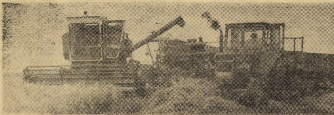
In aceste zile cu timp prielnic de lucru, toate combinele sînt antrenate la recoltat