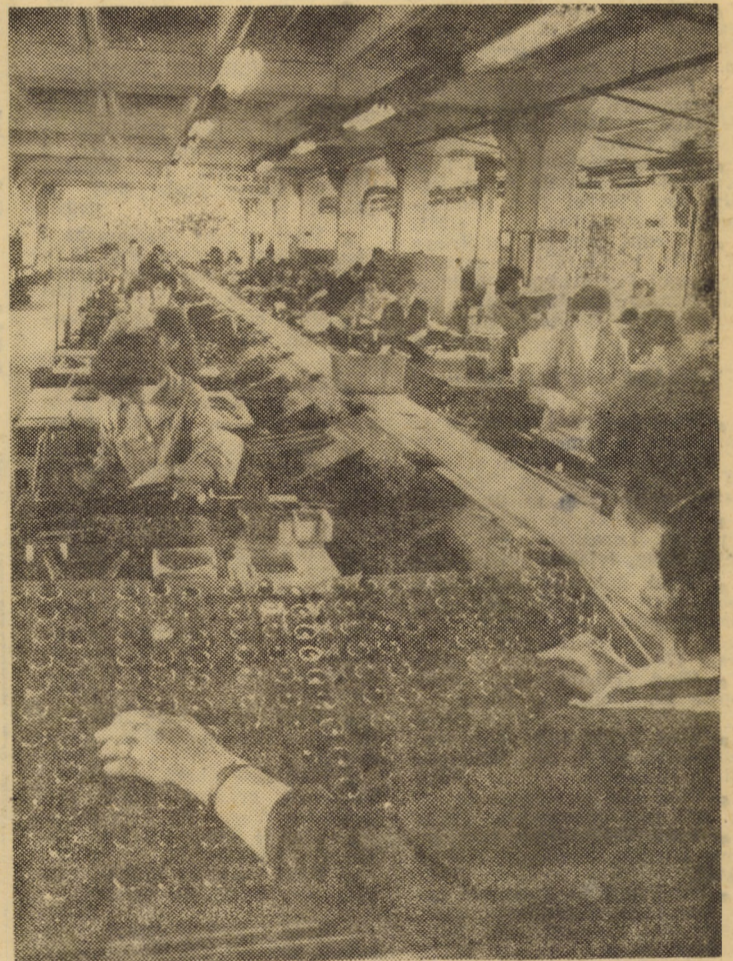
În ultimii 20 de ani, prin grija partidului și a statului nostru, în județul Sibiu au fost ridicate noi unități industriale, moderne utilizate, fapt care atestă impetuoasa dezvoltare echilibrată a tuturor localităților. În imagine: una din benzile cu deservire automată a locurilor de muncă la unitatea marochinorie din Săliște a întreprinderii „13 Decembrie“ Sibiu