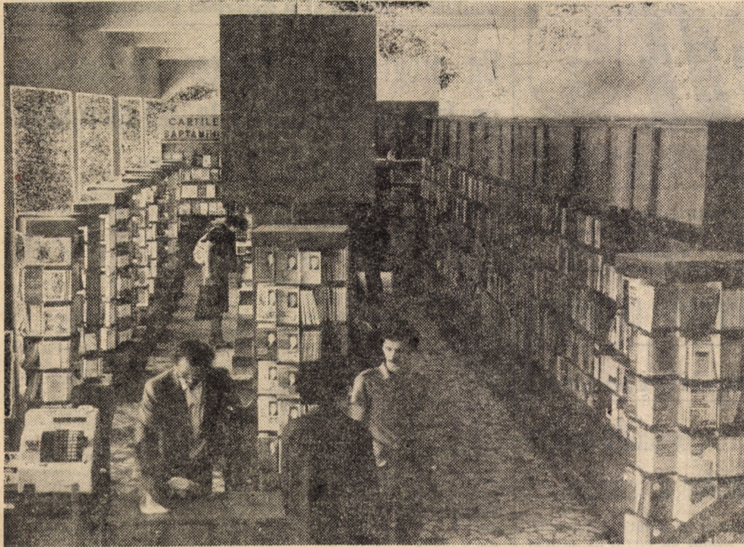
Imagine de la standurile librăriei „Lucațărul” cea mai mare dintre unitățile Centrului de librării din Sibiu.