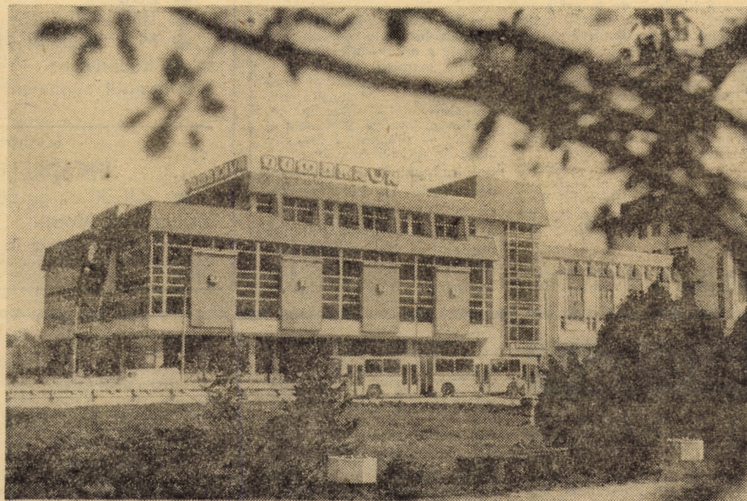
În peisajul citadin sibiian, magazinul universal „Dumbrava” semnifică înnoirea rapidă a spațiilor comerciale în perioada care a trecut de la Congresul al IX-lea al partidului, precum și — prin competența și pasiunea lucrătorilor — creșterea nivelului calitativ al desfacerii de mărfuri