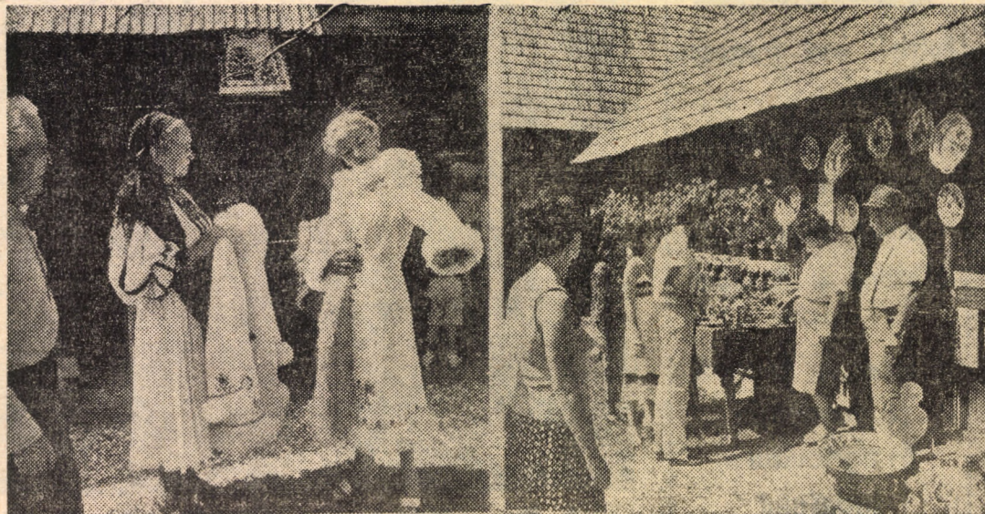
Imagini de la Tîrgul creatorilor populari din România organizat la Muzeul tehnicii populare din Dumbrava Sibiului.

11,30 mea c filmot „Balad riuca” cunun mănes Albur (p.c.) în ca bilită Repor derea 19,00 Tara 19,40 niei (c artisti n-a f 21,50 Inchic lui.