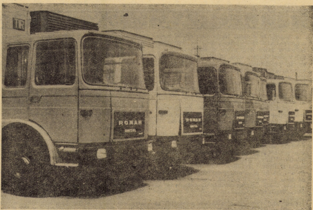
Un lot de autospeciale, purtînd marca „Automecanica” Mediaș, — care urmează să fie expediat beneficiarilor