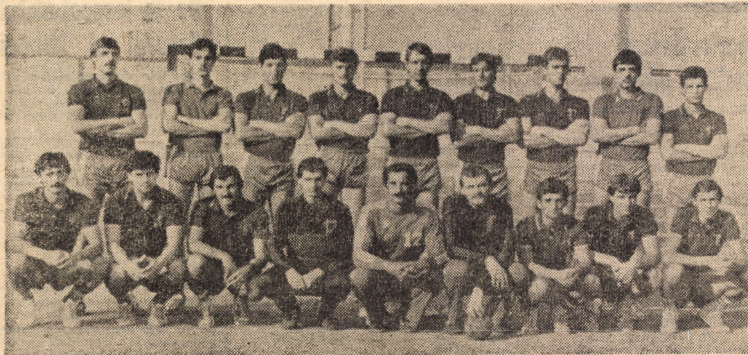
Independența-Carpați Mirșa 1985 — echipă de care se leagă speranțele iubitorilor de handbal