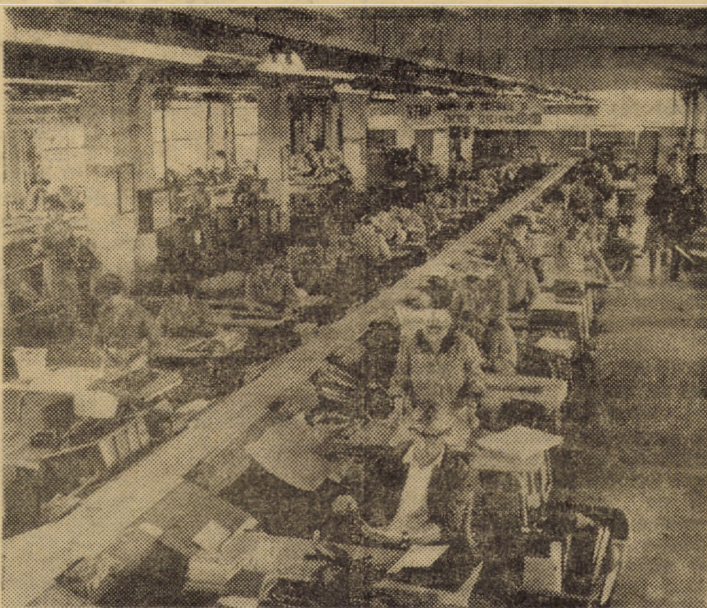
În fotografie, o secvență de muncă în noua secție de marochinărie de la Săliște, a întreprinderii „13 Decembrie”, unde se realizează și produse destinate exportului.