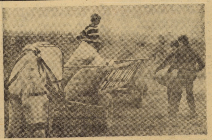
cartofilor. Pe tarlău de lingă șosea patru mașini de recoltat tip E-648, conduse de