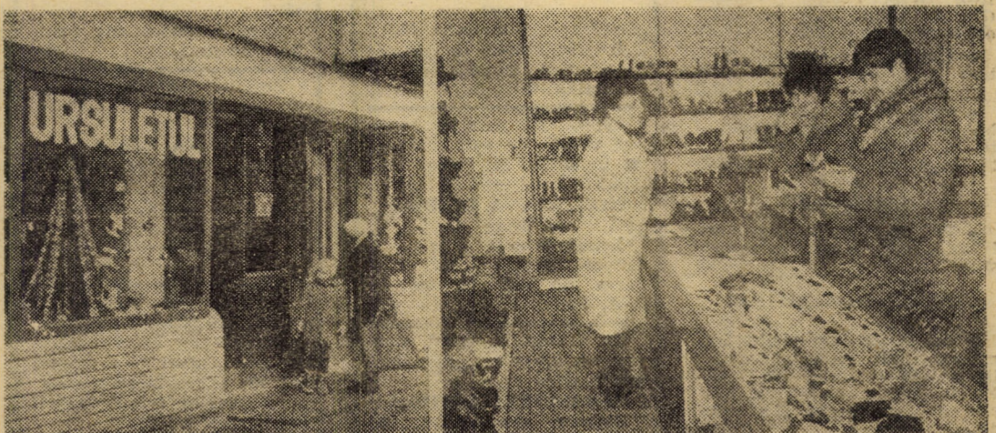
Magazinul nr. 66 „Ursulețul”, pe care vi-l prezentăm în cele două fotografii, este specializat în încălțăminte pentru copii și a fost deschis recent pe b-dul Mihai Viteazul din cartierul sibian Hipodrom.

... și contraperformanțe: cele mai însemnate restanțe în producție pe 1985 se localizează (motivele sînt mai ales obiective) la I. M. Mîrșă, I.M.M.N. Copsa Mică și „Independent” Sibiu. În încheiere, să dorim anului 1986 cît mai multe și mai semnificative fapte și realizări în muncă, demne de a figura în viitoarea retrospectivă. (Ion S.).