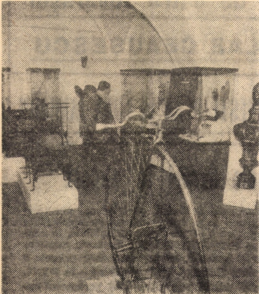
Imagine din expoziția temporară de feronerie organizată de secția de istorie a Complexului muzeal Sibiu și găzduită de galeria de artă Brukenthal

Galeria de artă Brukenthal găzduiește expoziția temporară Feronerie, artă și meșteșug . Materialul tridimensional ce se prezintă într-o mare diversitate de forme este ordonat atît cronologic, cît și pe meșteșuguri.