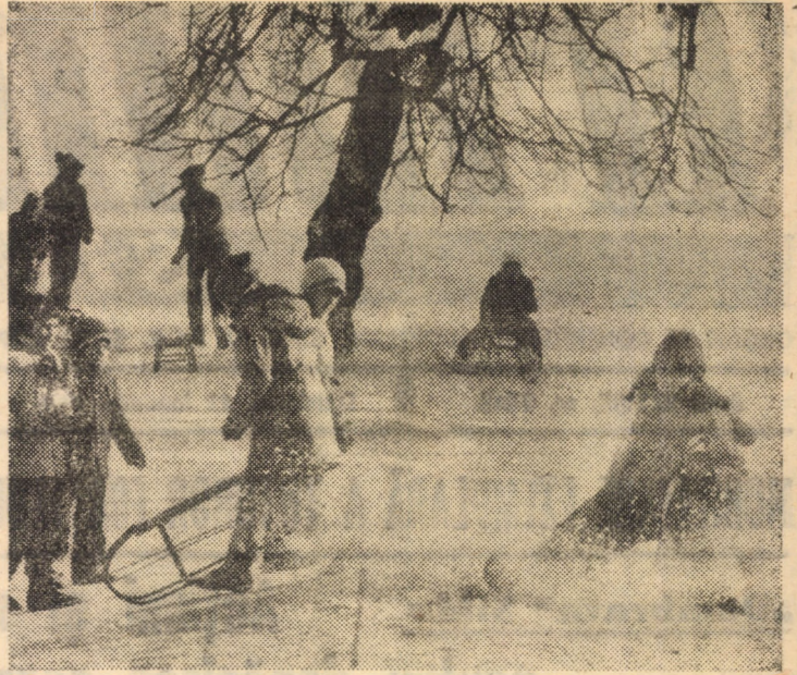
Și totuși, în această vacanță ne mai dăm pe derdeluș...