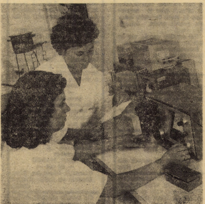
Odată cu darea în funcțiune a noului spital de adulți din Sibiu, laboratoarelor de analiză, farmaciei precum și celorlalte instalații de investigații li s-au creat spații corespunzătoare unde munca se desfășoară în condiții optime

Ceea ce naște un semn de întrebare și lasă loc firește unor considerații despre modul în care a fost abordată selecționarea participanților la aceste concursuri este faptul că, la profilele păsări și porcine, legumicultură și viticultură (categ. peste 30 ani) nu s-a prezentat nici un concurent. Or, după cum este știut, aceste specii și activități dețin o pondere destul de însemnată în agricultura județului nostru, meritînd deopotrivă aceeași solitudine. (N.I.)