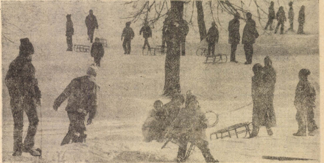
În Sub arini, săniușul e la ordinea zilei

În casele pionierilor și șoimilor patriei, în cluburile de vacanță, cei mari le-au rezervat, ca de obicei, celor mici clipe de mare bucurie și frumusețe. Paleta diversificată de acțiuni politico-ideologice și cultural-educative organizate antrenează un mare număr de copii. Să urmărim doar câteva din „traseele” vacanței. La C.P.S.P. din Medias s-a vernisat, zilele acestea, o expoziție de artă plastică purtînd genericul „Pace pentru o copilărie fericită”. Expoziția cuprinde cele mai izbutite lucrări realizate de pionierii medieseși. Foarte interesant a fost medalionul literar „Mihai Eminescu” organizat, în 15 ianuarie a.c., de unitatea de pionieri de la Școala generală Birghiș și susținut de membrii cercului de literatură.