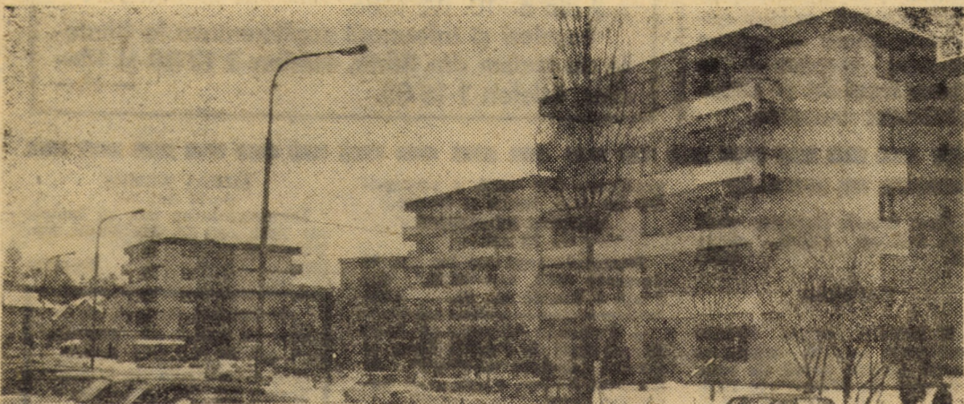
Astăzi cartierul Ștrand din Sibiu prezintă o frumoasă și modernă arhitectură urbanistică