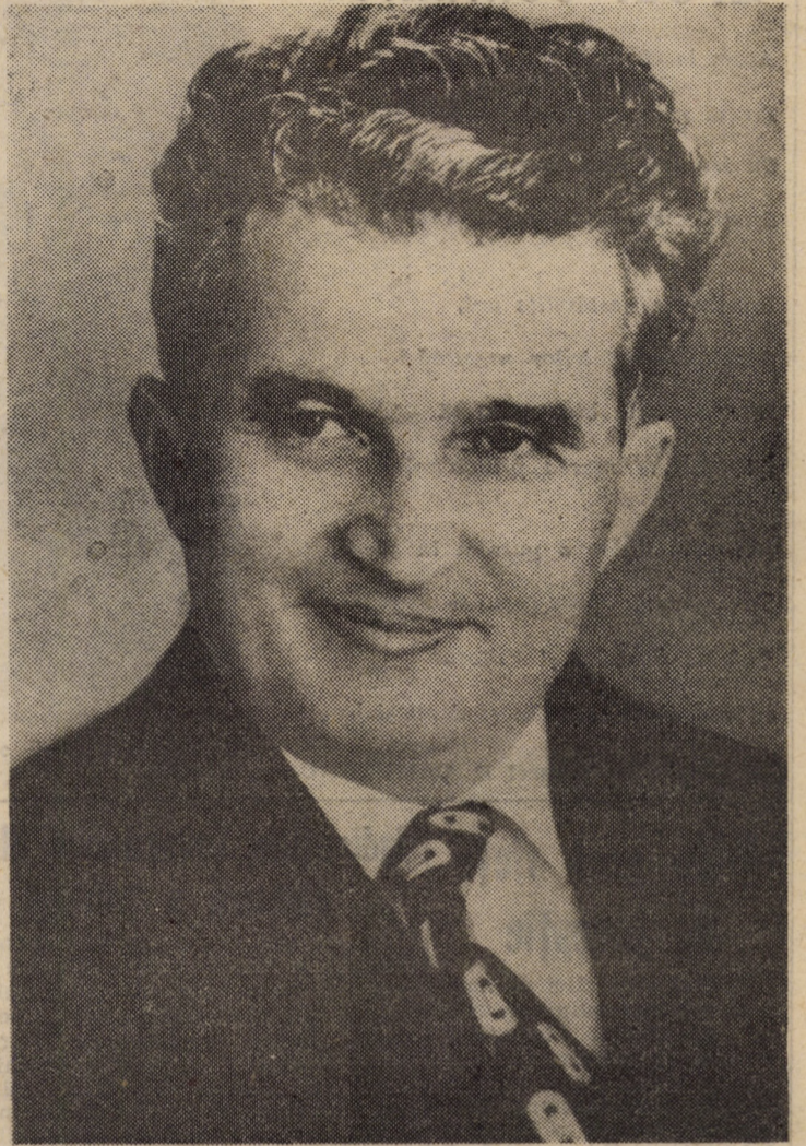
Ctitor de prea frumoasă țară