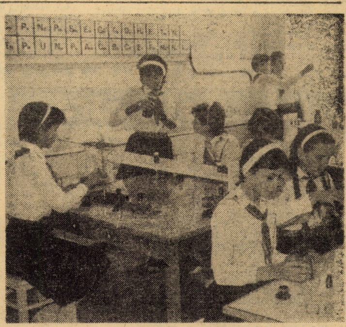
Pasiunea cu care activează membrii Cercului de chimie al Casei pionierilor și șoimilor patriei din Sibiu, bunele condiții create în laboratoare bine dotate, asigură elevilor, un sprijin prețios pentru aprofundarea cunoștințelor din această disciplină școlară

Așadar, nu se poate spune că în sectorul centralelor hidroelectrice, în județul nostru nu există suficiente strădanii și preocupări pentru sporirea și modernizarea capacităților de producție, pentru utilizarea cu maximum de randament a acestora. Socotim totuși că, printr-o mai bună folosire a potențialului hidroenergetic existent, prin scurtarea duratei lucrărilor de revizii și reparații producția poate și trebuie să marcheze o curbă ascendentă. De subliniat că, în conformitate cu prevederile Programului suplimentar de producție industrială pe anul 1986, adoptat de Comitetul Politic Executiv al C.C. al P.C.R., se are în vedere creșterea mai puternică a producției de energie electrică, practic în acest domeniu depășirile fiind nelimitate. În acest spirit trebuie refăcute toate programele și planurile de măsură, regîndînt întreaga strategie de acțiune, astfel încît sarcinile de plan pe acest an să fie îndeplinite și depășite în mod substanțial.