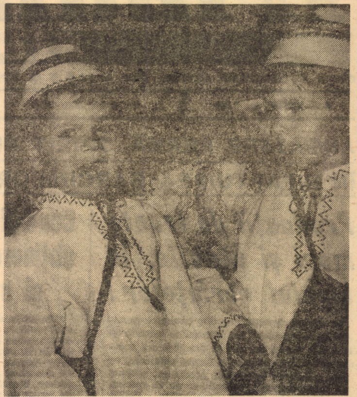
Copiii noștri — purtători ai tradițiilor culturii populare românești