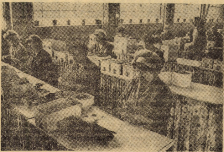
Imaginea înfățișează munca susținută a colectivului de la montaj „articole de scris” din cadrul întreprinderii sibiene „Flora”

În încheiere, se impune a face sublinierea că — lucru perfect valabil pentru toate organele locale ale puterii și administrației de stat —, consiliile populare poartă întreaga răspundere pentru această acțiune, că au obligația să ia toate măsurile ce se impun pentru îndeplinirea integrală a sarcinilor de producție și de livrare la fondul de stat, precum și pentru asigurarea fondului de consum local. În această acțiune, toți locuitorii satelor au obligația, prin lege, să-și aducă totala contribuție.