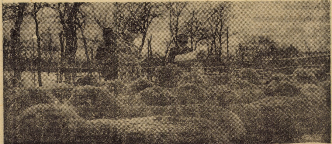
Comisiile de recenzie, în acțiune. Un motiv în plus de satisfacție pentru gospodarii de frunte ai satelor