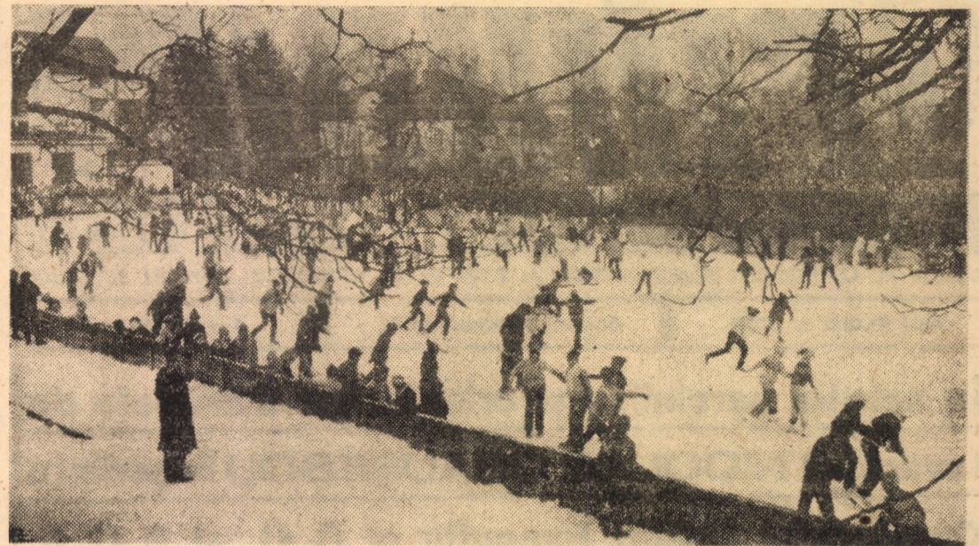
Patinoarul tineretului din Sibiu atrage în aceste zile de iarnă autentice sute de copii, dornici să-și petreacă timpul liber într-un mod cit mai plăcut

Știm că există cauze (și obiective) care fac ca marfa să nu ajungă totdeauna în cele mai bune condiții în magazinele de prezentare și desfășurare. Dar, modul în care unii vînzători din aprozarea oferă produsele (stricate, amestecate cu pămînt, de categorii inferioare cu prețuri de categorii superioare etc.) ne face să