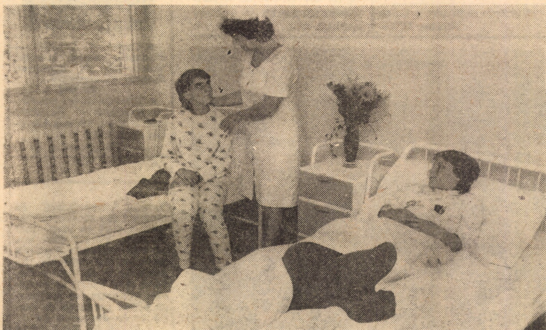
Noul spital de neuropsihiatrie infantilă dat în folosință la Sibiu dispune de saloane utilitate funcțional și modern. Vă prezentăm o imagine dintr-un salon al staționarului noului edificiu spitalicesc sibian