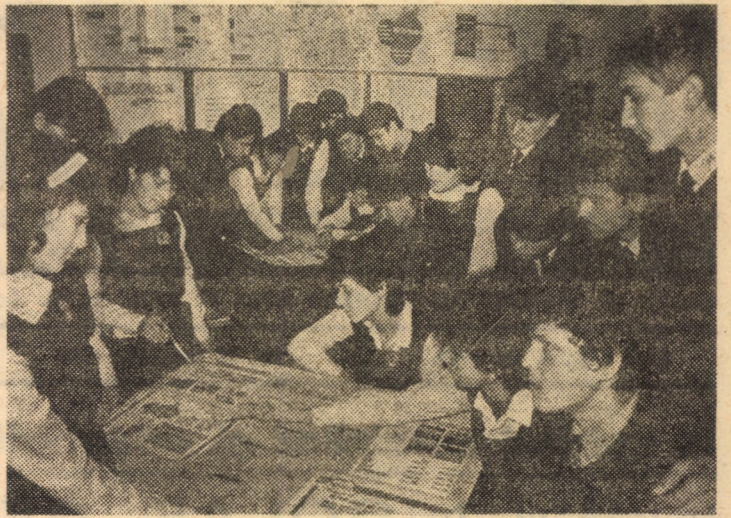
Pe baza unui bogat material ilustrativ de care dispune cabinetul de sociologie al Liceului „St. L. Roth” din municipiul Medias (în fotografie), elevii ultimelor clase își întregesc cunoștințele teoretice, abordînd în discuțiile lor probleme de actualitate, înfățișînd drumul încununat de rodnice împliniri străbătut de poporul nostru

C. Arseni, s.a., „Craniostenozele”. Editura Academiei, 118 pagini. Lei 16.