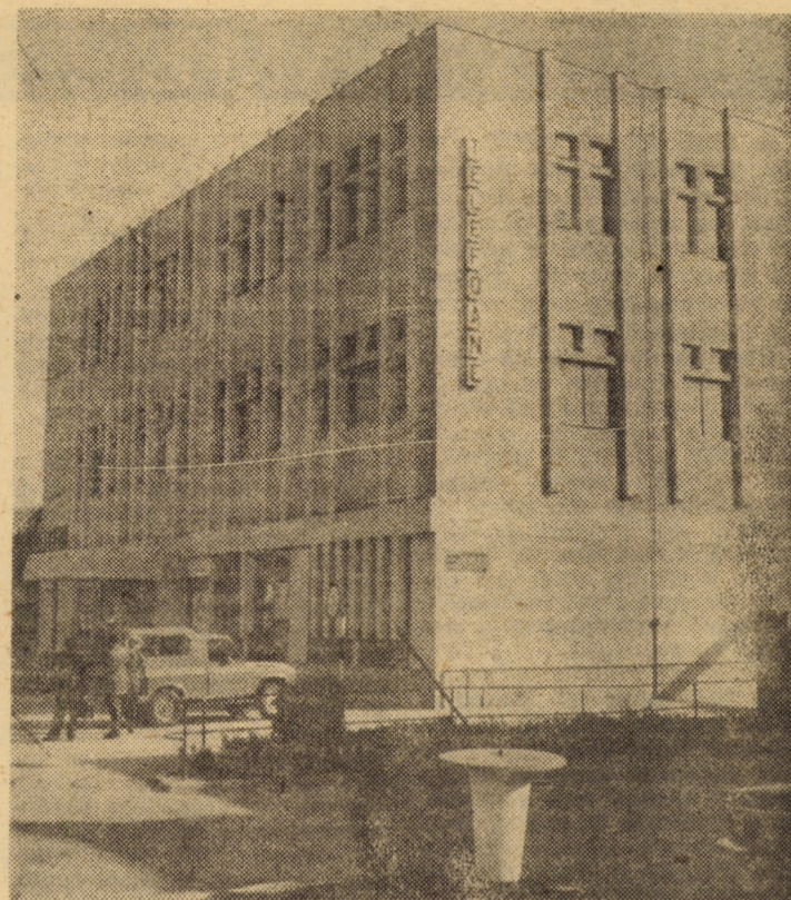
În orașul Agnita a fost dat de curind în folosință un nou edificiu social-edilitor — Oficiul P.T.T.R. — pe care vi-l prezentăm în imaginea de față