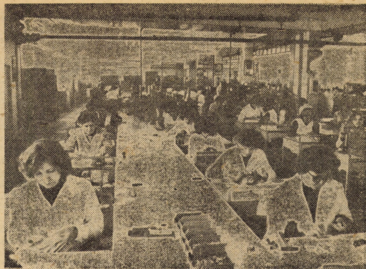
La întreprinderea de relee Mediaș — aspect din secția de montaj al componentelor aparatului electric. Participare efectivă, contribuție crescândă la dezvoltarea producției într-un sector „de vîrf”, purtător de progres tehnic

Așa cum s-a arătat în darea de seamă prezentată, în cursul anului 1985 întreprinderea a realizat o producție marfă industrială cu peste 700 milioane lei mai mare decât în anul anterior, aceasta și ca urmare a sporirii capacităților de producție cu fonduri fixe în valoare de 350 milioane lei. A continuat acțiunea de asimilare în fabricație de noi produse, astfel încât, la finele cincinalului încheiat, ponderea produselor noi și modernizate reprezenta peste 91 la sută