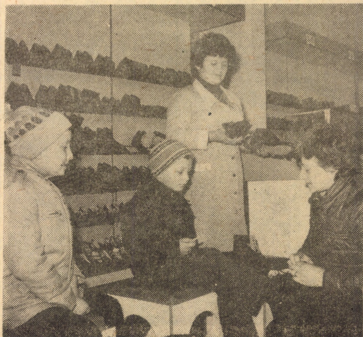
Secvență din magazinul „Ursulețul”, specializat în încălțăminte pentru copii, deschis recent în cartierul Hipodrom din Sibiu

Reamintim că la sediul F.C. Șoimii (Aleea Eminescu nr. 1) se eliberează în continuare abonamente, zilnic între orele 9-13. Pentru oamenii muncii de la I.P.A. Sibiu, abonamentele se distribuie la sediul întreprinderii.