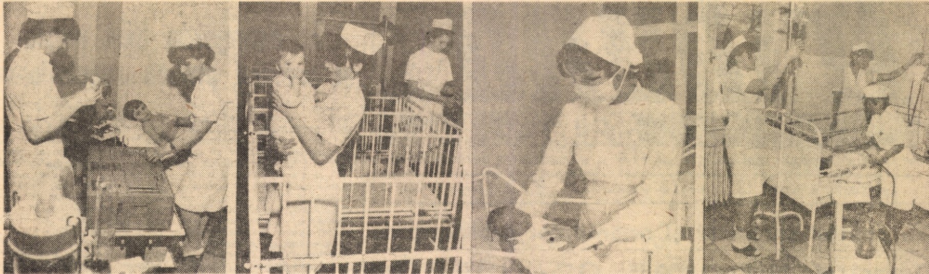
Imagini din secția de pediatrie a Spitalului județean