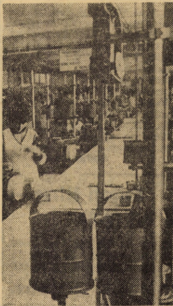
Secția bobinat — unul din compartimentele de bază ale Întreprinderii de relee Mediaș.