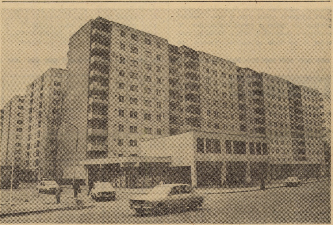
Unul din complexele comerciale, aflat la dispoziția locuitorilor cartierului „Vasile Aaron” din Sibiu

În comuna Rășinari există și alte particularități. Este meritul consiliului popular al comunei de a fi analizat pînă la amănunt condițiile de producție agricolă din fiecare gospodărie stabilind astfel, în cunoștință de cauză, planurile de cultură și obligațiile contractuale. Dar lucrurile nu sînt nici pe departe rezolvate. Procesul de modificare în structura familiilor are implicații permanente asupra reîmpărțirii terenurilor agricole — specific zonelor neocooperativizate —, situație ce trebuie avută în vedere pentru valorificarea neîntreruptă a potențialului productiv al pămîntului. În consecință, în aceste condiții, sînt necesare tehnologii noi, metode care să determine producții sporite, sisteme de creștere intensivă a animalelor și a păsărilor, cu microclimat și producții controlate. Din acest punct de vedere, experiența de la Rășinari privind realizarea de producții agricole mari pe suprafețe de teren restrînse, trebuie permanent îmbogățită, astfel încît locuitorii acestei străvechi așezări să contribuie cu cantități tot mai mari de produse agricole la fondul de stat.