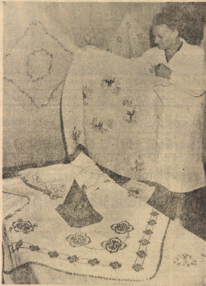
Imagini dintr-o expoziție cu obiecte realizate în ateliere de ergoterapie

Cotidianul „Viesnik” din Zagreb informează că profesorul Drago Plečko a elaborat o metodă de izolare a celulelor canceroase folosind bioenergia. Potrivit agenției Taniug, în urma experiențelor executate „in vitro” asupra unei tumori maligne, un sfer din celulele canceroase au înregistrat, în urma tratării radicale, după numai 15 minute. Astfel, ele au început să reacționeze normal, pierzîndu-și caracteristica de multiplicare. „Viesnik” adaugă, în același timp, că natura limitată a experimentului — care a fost urmărit de o echipă de specialiști a Universității din Zagreb — nu permite, pentru moment, concluzii definitive și nici speranțe exagerate, deși oncologii sînt chemați să acorde o mai mare atenție acestei metode, clasificată, pînă în prezent, în categoria fenomenelor paramedicale.