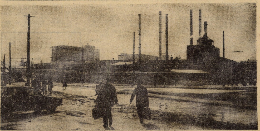
Din peisajul zonei industriale a „orașului de jos” din municipiul Sibiu

6. III: ● Această zi a fost desemnată de către pionierii membri ai unității Școlii generale nr. 2 din Tălmăciu, zi-record în colectarea deșeurilor de hîrtie.