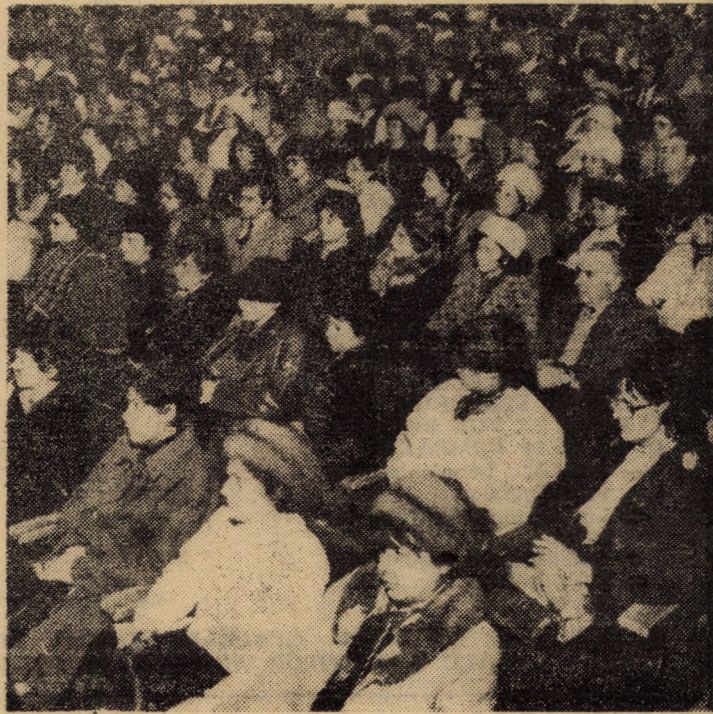
Aspect din timpul desfășurării adunării festive dedicată Zilei internaționale a femeii