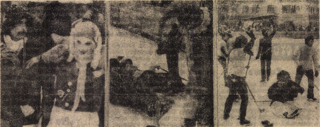
Casa de cultură a științei și tehnicii pentru tineret din Sibiu și clubul de turism „Sibiniensis” au organizat zilele trecute pe Patinoarul tineretului un foarte izbit spectacol purtînd genericul „Serbările gheții”. Un public numeros a petrecut clipe de incîntare în compania „artiștilor”, care s-au produs cu jocuri pe gheață, demonstrații de patinaj artistic și patinaj viteză etc., spectacolul incheindu-se cu o medită discotecă pe... gheață