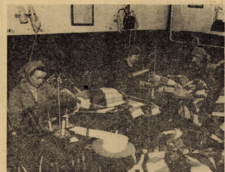
Operația de fasonare a păturilor în cadrul secției finisaj a întreprinderii „Progresul” din Orlat.