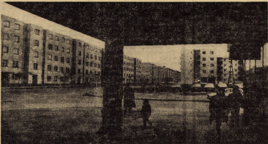
În aceste zile de martie, prin cartierul sibian V. Acron

Într-unul din numerele noastre următoare vom reveni, detaliat, asupra obligațiilor ce revin cetățenilor cu privire la înfrumusețarea, gospodărirea și igienizarea localităților, obligații prevăzute de Legea nr. 10/1982.