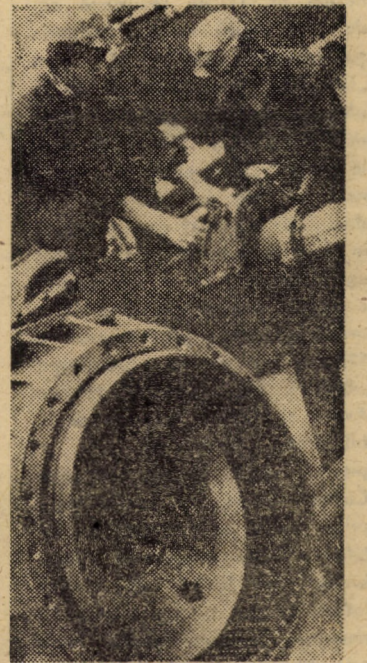
Faza de montaj a componentelor pentru autobasculante grele în secția punți-motoare a întreprinderii mecanice Mirsa

În pagina a III-a ne-am propus să relevăm — cu ajutorul datelor puse la dispoziție de tovarășul I. Grecu — conținutul și efectul onora dintre lucrări, privite prin prisma unor aspecte majore ale producției din întreprinderile beneficiare.