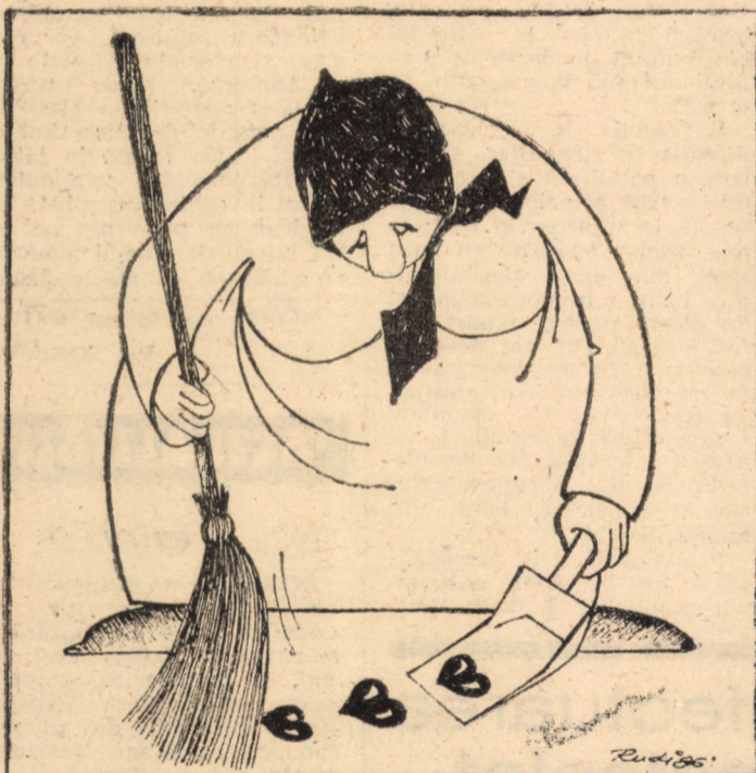
Caricatură de Rudy Schmuëckle