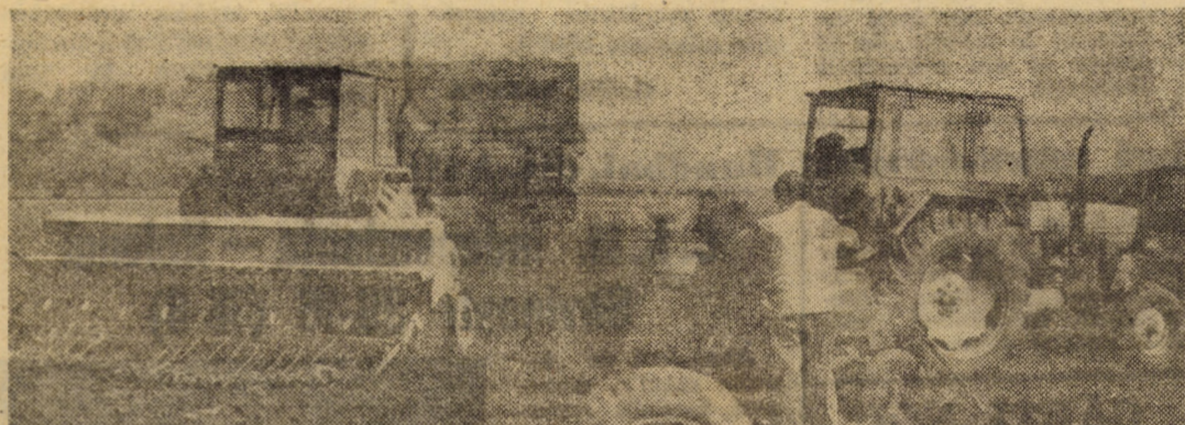
Obiectivul prioritar al acestei săptămâni îl constituie finalizarea lucrărilor din urgența I și cea mai mare parte a celor din urgența a II-a. Aceasta presupune o mare concentrare de forțe, lucru de calitate „zi lumină”