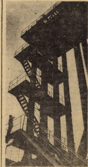
Geometrie industrială pe platforma Copșei Mici

(Continuare în pag. a III-a) Ion SORESCU