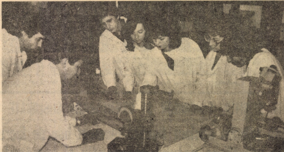
În laboratoare specializate cu o bună dotare tehnică, studenții Facultății de mecanică din Sibiu desfășoară o susținută activitate de cercetare — o muncă de anticipație, plină de satisfacții, a viitoarelor cadre ingineresti