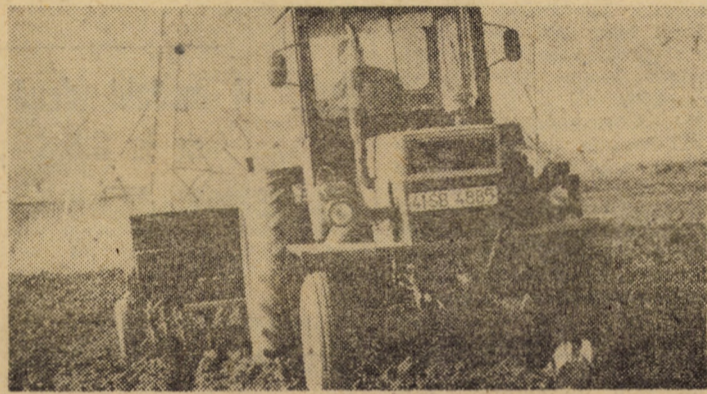
Condițiile agrometeorologice favorabile impun respectarea volumului de lucrări programat pentru fiecare utilaj.