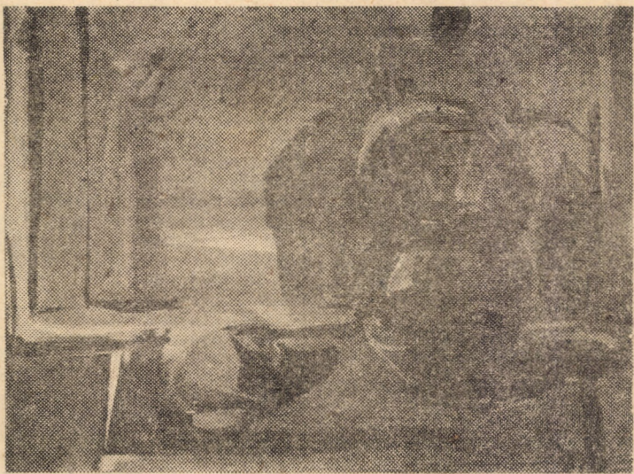
Natură statică cu portocală