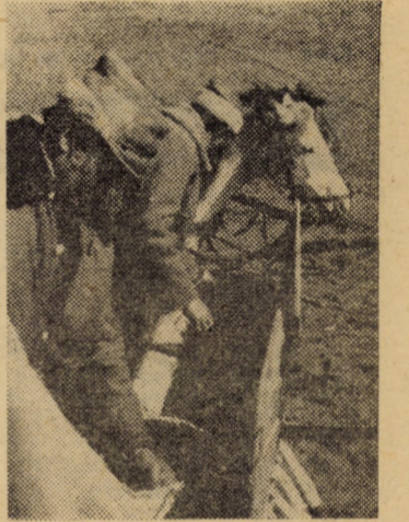
La transportul semințelor în câmp de un mare ajutor sînt atelajele cu cai. În această primăvară aproape în totalitate, alimentarea utilajelor de încorporat semințe în sol a fost făcută cu aceste economicoase mijloace de transport

Punctul de vedere al inginerului șef de C.U.A.S.C. este respectat de toți specialiștii din unități. Semănatul, în ziua de 20 martie, a fost declanșat numai după ce conducătorii procesului de producție și-au dat girul că terenul a fost temeinic pregătit pentru a primi sămînța.