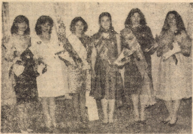
Câștigătoarele fazei municipale a „Concursului muncii, frumuseții și tineretii”.