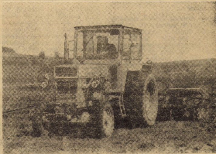
Momente de vîrf la lucrările de însămînțat sfeclă de zahăr, gullii și sfeclă pentru furaje

Se desfășoară din plin și activitatea de plantat cartofi de toamnă. Pînă ieri, lucrarea a fost realizată pe 681 hectare. Se acordă o atenție deosebită pregătirii terenurilor destinate culturilor intensive.