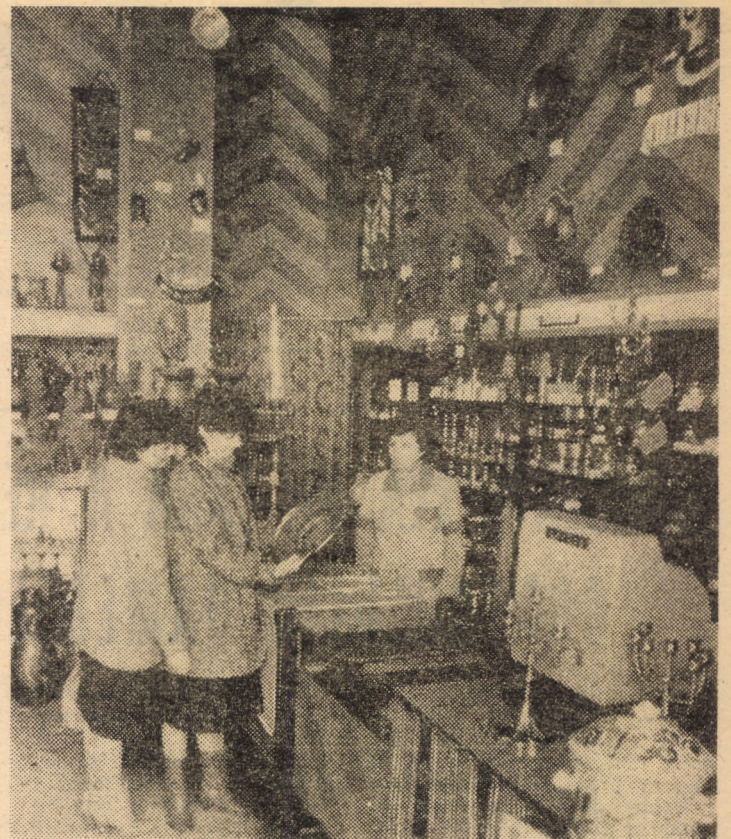
Magazinul nr. 29, „Cadouri” din municipiul Mediaș — din interiorul căruia vă prezentăm imaginea de mai sus — se remarcă printr-o atractivă prezentare a articolelor de artizanat

20,00 Telejurnal. 20,20 Actualitatea în economie. 20,35 Partid birou, vitează țară.