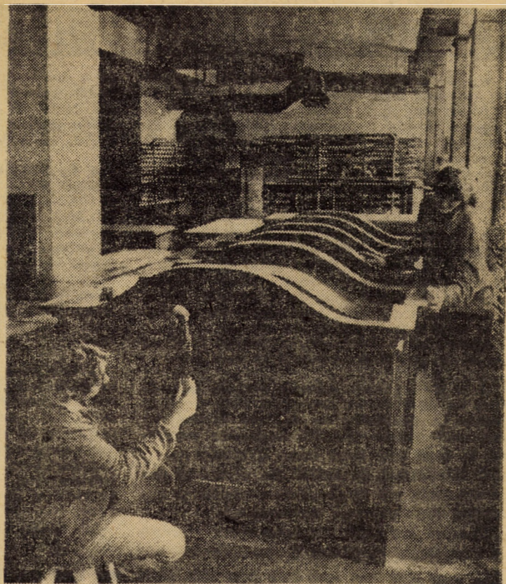
I.P.L. Sibiu, sectorul II mobilă. Un ultim finisaj al produselor înainte de expediere la beneficiari