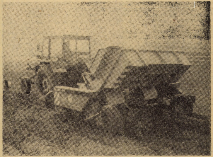
Plantarea cartofilor de toamnă — o lucrare de mare actualitate în toate zonele județului nostru

În conformitate cu înțelegerea intervenită între cele două părți, vizita pe care urma s-o efectueze în Republica Socialistă România președintele Partidului Frelimo, președintele Republicii Populare Mozambic, Samora Moises Machel, împreună cu tovarăsa Graça Machel, a fost aminată pentru o dată ce va fi convenită ulterior.