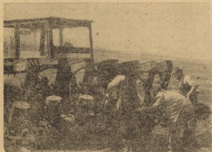
Stadiul atins la însămînțatul porumbului pentru boabe în C.U.A.S.C. Loamneș (23 la sută din suprafața planificată) impune o intensă mobilizare a tuturor forțelor umane și materiale în vederea atingerii unor ritmuri superioare de lucru. Dintre unitățile componente ale consiliului unic menționat, C.A.P. Armeni — în fotografie vă prezentăm o secvență de muncă de pe tarlăua „Moine” — se situează pe primul loc cu 39 la sută din suprafața afectată acestei culturi

secretara organizației de partid nr. 2, magazinul „Dumbrava” Sibiu