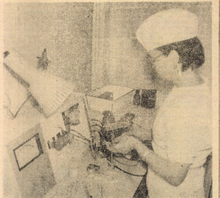
Laboratoarele de investigații, modern utilizate ale noului spital, dat în folosință în municipiul Mediaș, constituie un real ajutor pentru cadrele medicale în elaborarea diagnosticului într-un timp cit mai scurt