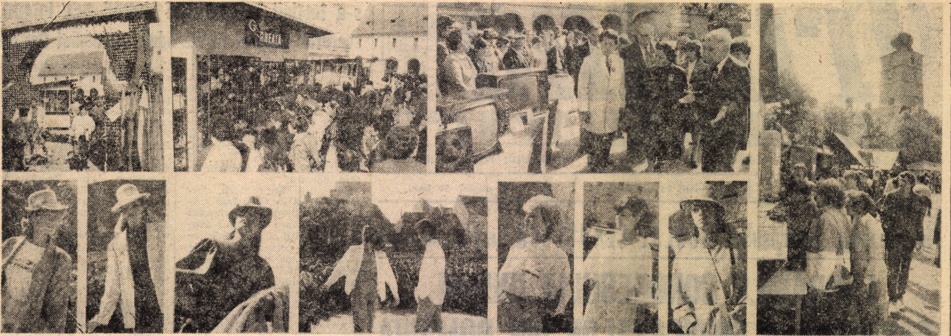
IERI, LA SIBIU, S-A DESCHIS