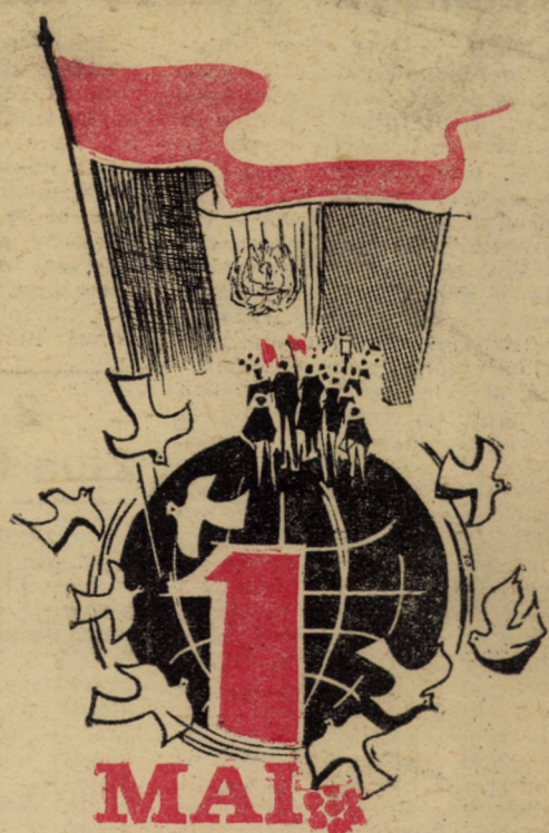
Desen de Ștefan ORTH

2 MAI - ZIUA TINERETULUI TINEREȚE - IDEAL, MUNCĂ, SPIRIT REVOLUȚIONAR