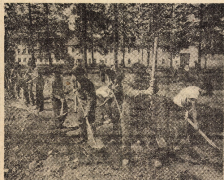
Tineretea în haine de lucru: la întreținerea străzilor 11 lunie și Reconstrucției din municipiul Sibiu, tineri uteciști din întreprinderile „Flamura roșie” și „Drapelul roșu” contribuie, prin muncă patriotică, la amenajarea unui parc

● A început popularea cu berbecuți a îngrășătorilor de la Alămor, Avrig, Cornăești, Mihăileni și A.E.I. Șura Mică. Au fost luate toate măsurile pentru respectarea tehnologiei privind întreținerea și furajarea.