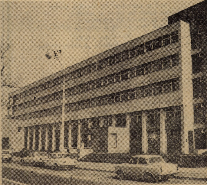
Doă imagini semnificative pentru transformările cunoscute de localitățile patriei în „Epoca Nicolae Ceaușescu”, asigurîndu-se astfel, și în județul nostru, condiții mereu mai bune de viață și asistență socială locuitorilor. În imagine — cartierul Gura Cimpului din Mediaș și noul Spital județean din Sibiu